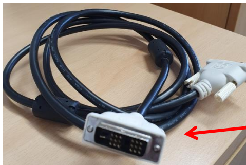
DVI-Kabel (Verbindung PC – Bildschirm)