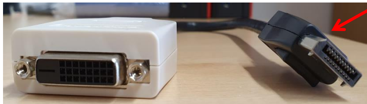
Display-Port-Adapter (Verbindung PC – 2. Bildschirm)