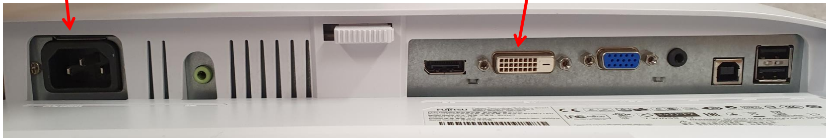
DVI-Kabel (Verbindung PC – Bildschirm)